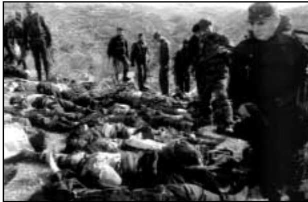
Türkische Militärs zählen Leichen von PKK-Kämpfern

Im Juli 1994 führte die in Gang gesetzte Massenhysterie dann in Hannover zur Erschießung eines Kurden durch die deutsche Polizei. Sein Verbrechen: das