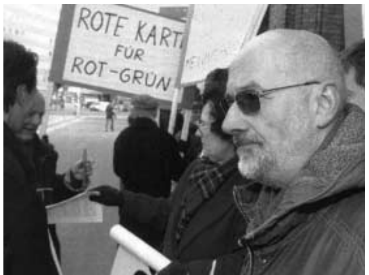
Neu-Nazi Horst Mahler organisiert jetzt Demos gegen Überfremdung

Ehemalige SDS-Genossen haben sich nun in einer Broschüre zur Wehr gesetzt. »Nationalisten waren wir nie! Wir lehnen die Verfälschung unserer politischen Geschichte mit nationalistischen Erklärungsmustern mit aller Entschiedenheit ab.«