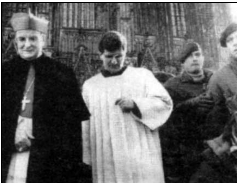
Dompfaffen mit Militärs 1999

Nur 150 Linke fanden sich zum Protest gegen den Soldatengottesdienst am 21. Januar mit Kardinal Meisner und 1.500 "frommen" Soldaten am Kölner Dom ein. Mit der Kirche werden die Arbeitermassen nur wieder im Völkergemetzel enden. Sie werden die Pfaffen erst abschütteln, wenn sie eine freie Gesellschaft ohne Tod und Elend gründen.