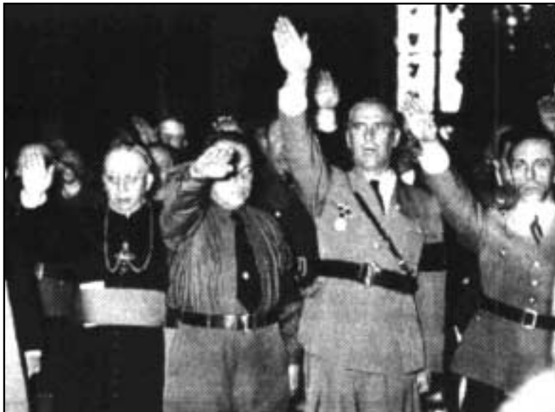
Dompfaffen mit Militärs 1933

Die Militärs wollen, daß Gott ihnen hilft. Dann können sie mehr töten. Das haben wir doch schon 1933 gehört. Niemand ist mehr tiefgläubig. Wozu brauchen Sie da noch die Religion? Der Kapitalismus hat für seine Interessen, die Völker zu unterdrücken, die Religion umgewandelt. Die Kirche dient nur noch dem großen Geld und seinen Kriegen.