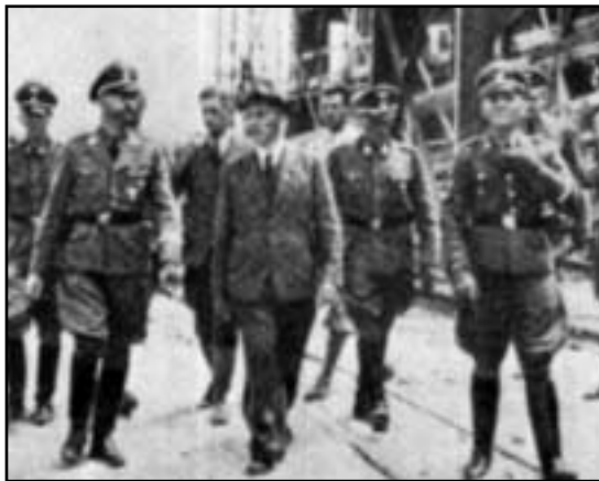
Himmler und IG-Farben Vertreter besichtigen Auschwitz

Der Deal der deutschen Kapitalisten mit Hitler bestand nun darin, daß er die Arbeiterbewegung zerschlagen und den Krieg für sie führen sollte. Und genau das tat er auch. Unmittelbar nach der