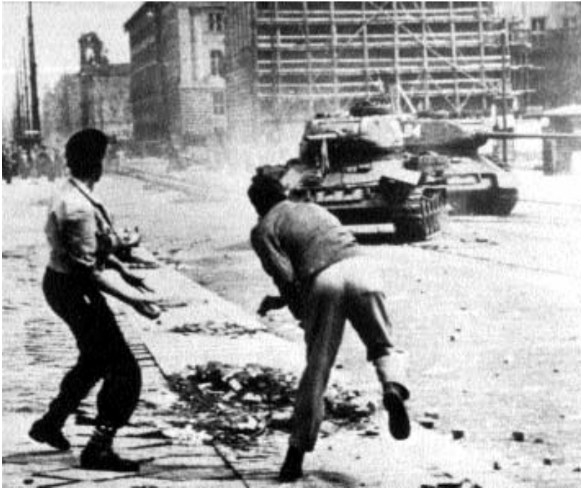
Juni 1953: Arbeiteraufstand gegen den Staatskapitalismus

Führer aus Deutschland verlassen konnten.