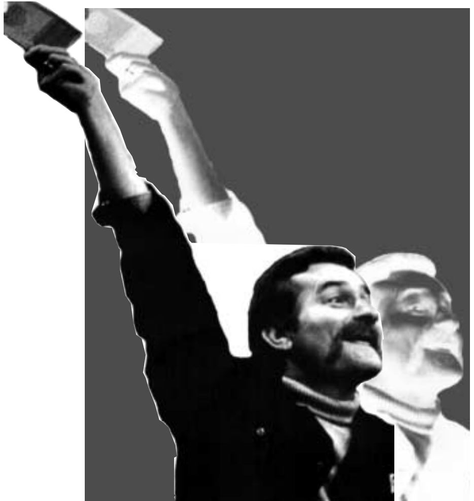
Lech Walensa wandelte sich vom Arbeiterführer zu einem der aggressivsten Kürzungspolitiker

Ungefähr 80% der polnischen Menschen waren dafür, der NATO beizutreten und nur sieben Abgeordnete stimmten im Parlament dagegen. Der Balkankrieg begann nur zwei Wochen, nachdem Polen