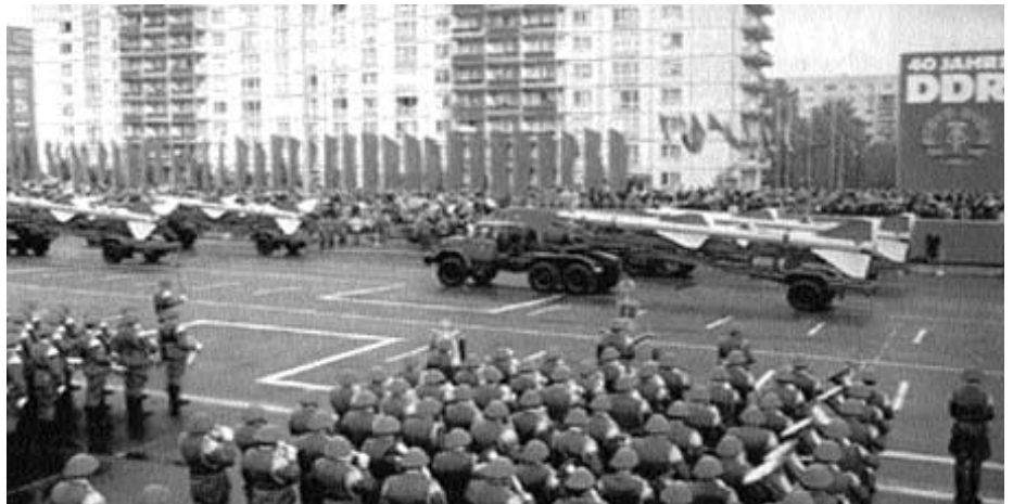
1979 feierte die DDR noch mit großem militärischen Brimborium ihr 40-jähriges Jubiläum. Zehn Jahre später war sie pleite